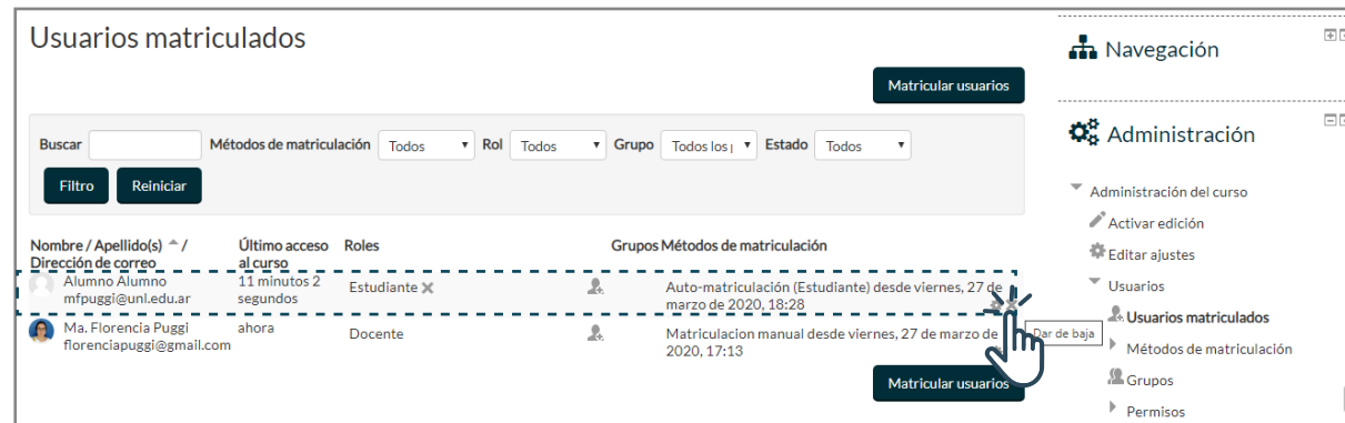
Interface del PASO 2: Lista de usuarios matriculados con opciones de edición, asignación de roles, matriculación y desmatriculación.