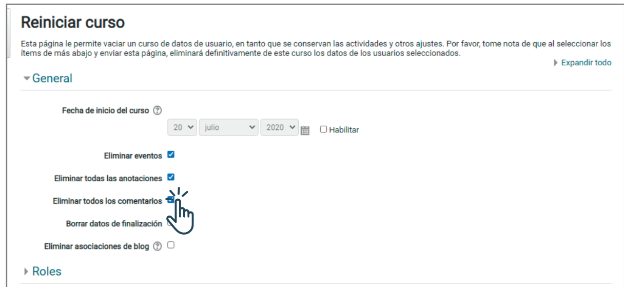
Interface del PASO 2: Vista de la sección General para reiniciar curso.